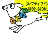
illustration by Hajime Anzai

それは現在、東京オペラシティ のアートギャラリーに掲出されて います。磯崎新氏の概嘆を再録す れば、「まるで列島の水没を待つ亀 のような鈍重な姿」。而してバルセ ロナ夏季五輪、トリノ冬季五輪の 主要競技施設を設計した磯崎氏は 先日、有楽町の日本外国特派員協 会で会見に臨み、以下の指摘と提 案を行いました。