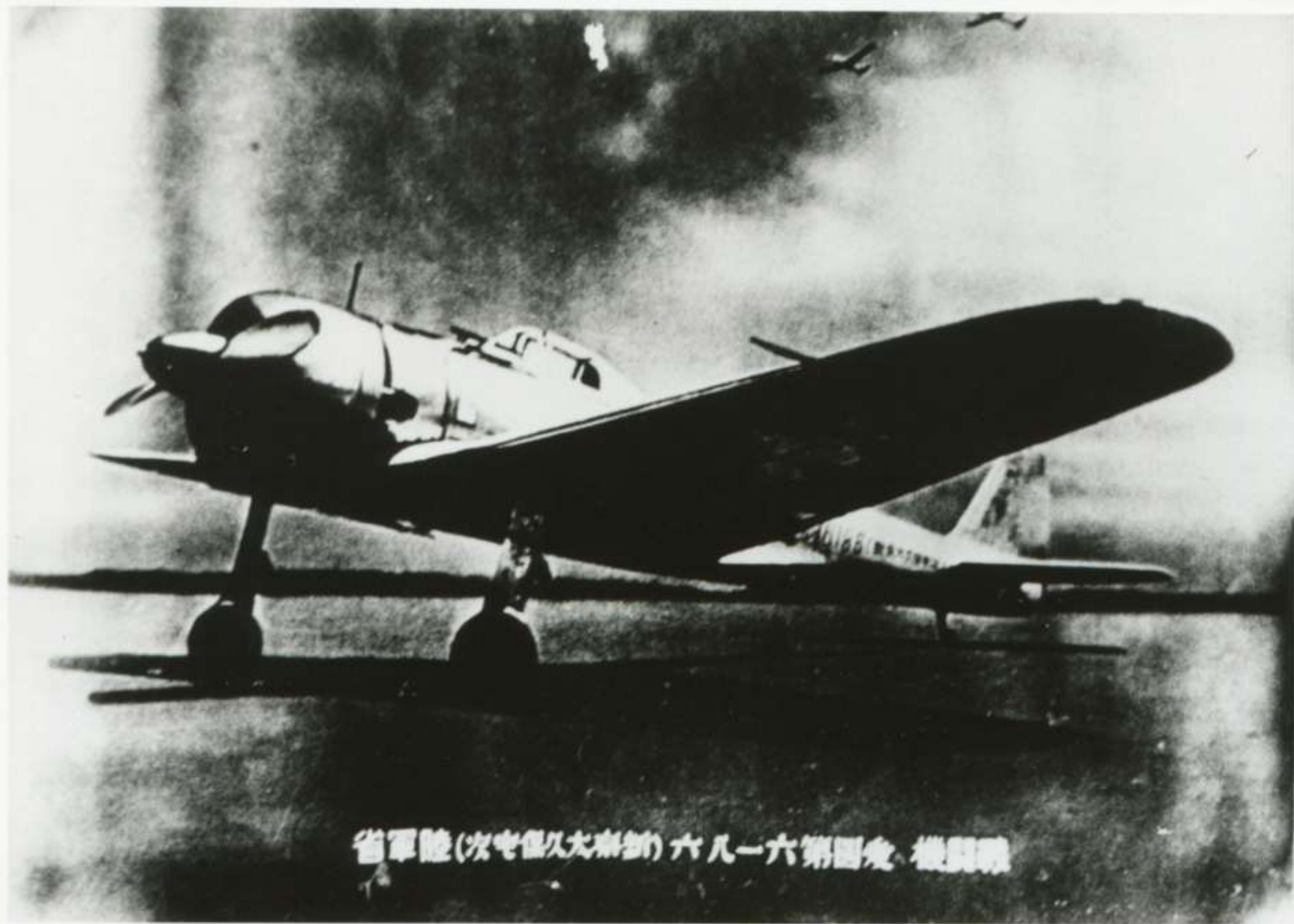
省軍陸(次中保久大東新)六八一六第四号 機開戦