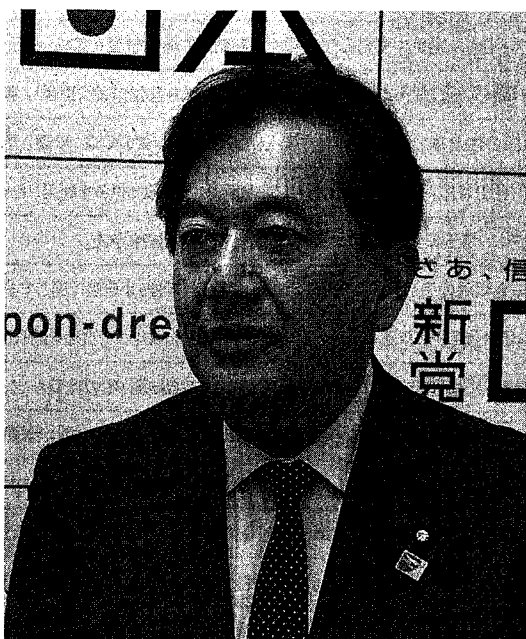
田中康夫・新党日本代表。衆議院議員、作家。元長野県知事。一橋大学法学部卒業。大学在学中の「なんとなく、クリスタル」で1980年度文藝賞を受賞。95年、阪神・淡路大震災後、神戸でボランティア活動に従事する。2000年、長野県知事に就任。2007年7月、比例区にて参議院議員に当選。2009年8月、兵庫8区(尼崎市)より衆議院議員に当選。56歳。http://www.nippon-dream.com/

2。人口六〇〇〇人弱の飯館村に限っても、ゼネコンが元請けの除染費用は三二〇億円強です。その税金を新天地での村民の生活再生に用いるべきです。