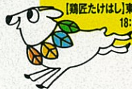
illustration by Hajime Anzai

を質すと、外務大臣レウエルで話し合つたレウエルの事象である旨、平然と言いつちました。国家の最高指導者が領土問題は優先順位が低い、と明言したのです。 政権交代前の2008年7月に米連邦政府機関の地名委員会が竹島を韓国領土と記載した際、日本政府として特別なアクションを起こす考えは無い。首相が抗議を行う意思は無い。何故、必要なのか」と官房長官が見ています。 日本の領土だと日本共産党も主張する竹島に、民主党政権も自民党政権も俯抜け状態。「オスプレイ配備の米政府の方針に、どうしろ・こうしろと言えぬ話ではない」と首相が嘯く日沈む国は、いっそ「主権国家放棄宣言」を行い、グアム同様に参政権を有さぬ米国の準州に転じた方が判り易いかもしれません。